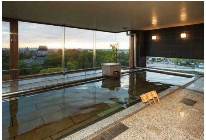
대욕탕으로부터 오카자키 성이 보입니다.