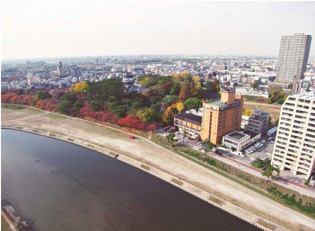
오카자키시(岡崎市)의 중심으로 있습니다.