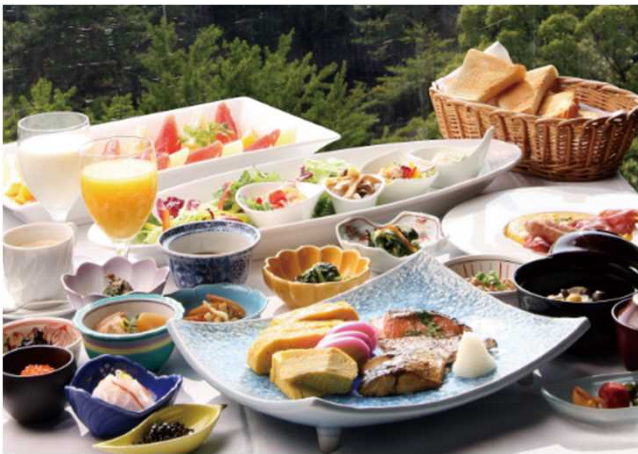
아침 식사 예(9층 레스토랑)